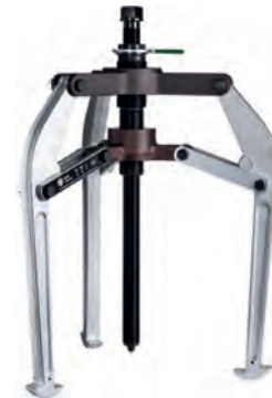
250 mm mérettől