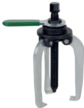
200 mm méretig